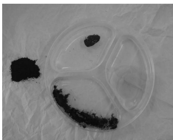
Рис. 3. Эксперимент по поглощению отработанного масла автотранспортных предприятий разработанным нефтесорбентом

Эффективность сорбента проверяли методом сорбции отработанных масел автопредприятий с водной поверхности (рисунок 3).